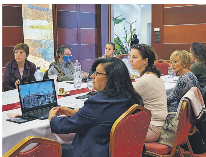
A női vállalkozók együttgondolkodását segítette elő a rendezvény

Ezt a törekvést segíti az október végére pályázati forrásból elkészülő kézikönyv, ami a női vezetőket és vállalkozókat szólítja meg – tudtuk meg Sörös Pétertől, a Bács-