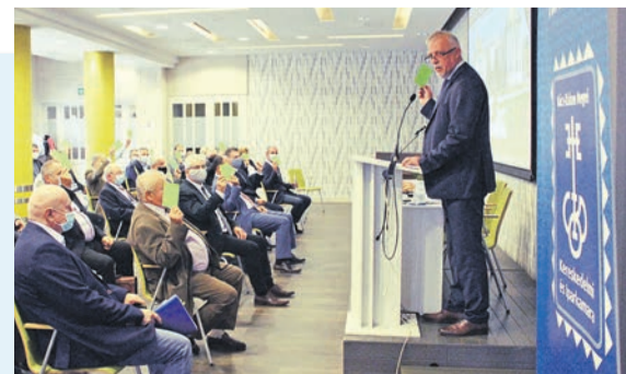
Felvételünk a kamarai elnökségi választáson készült