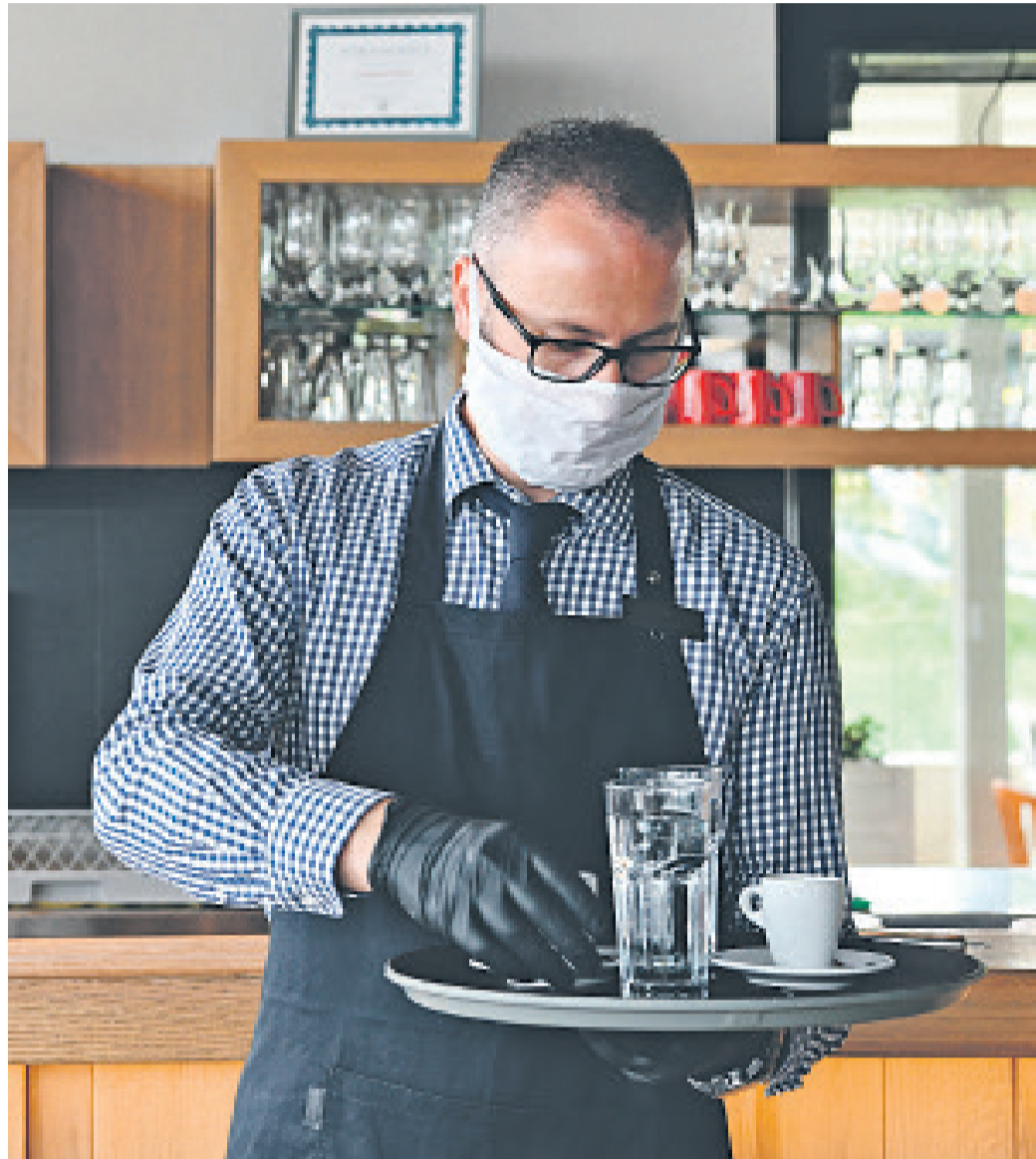
A vendéglátással foglalkozó cégek is részt vehetnek a programban

Az említett vállalkozások számára a Széchenyi Turisztikai Kártya 2020. október 22-től • 0% kamattal, • 0 Ft kezelési költséggel, • 0 Ft bírálati díjjal,